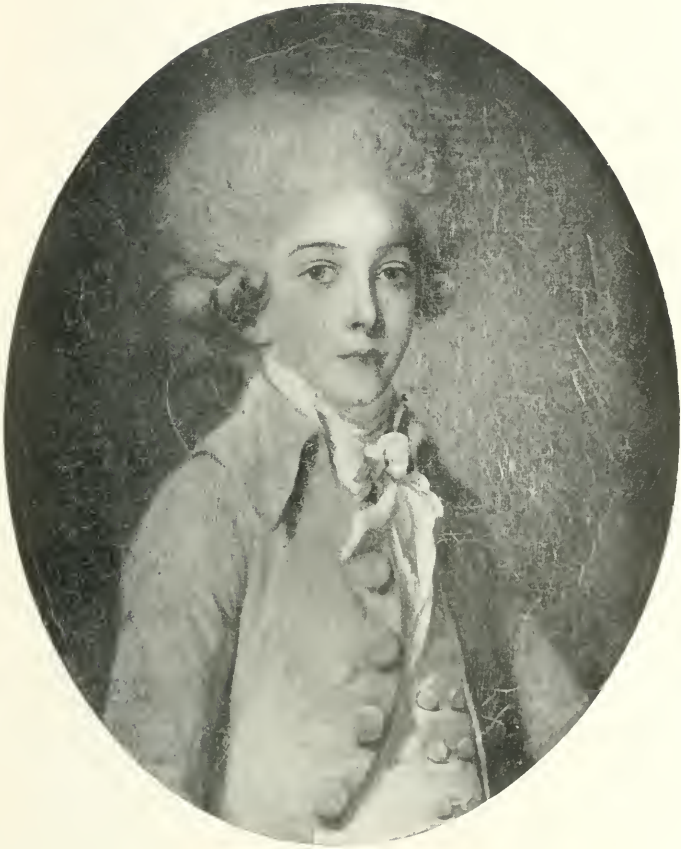
LE DUC D'ENGHEN, ENFANT